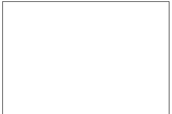
Figura 3. Aspecto Morfológico da Fratura do Aço AISI 304, na Direção Transversal à Laminação. 2000 X.

As Fig. 3 e 4 mostram a morfologia da zona de fratura para os aços inoxidáveis AISI 304 e 348 L*, respectivamente.