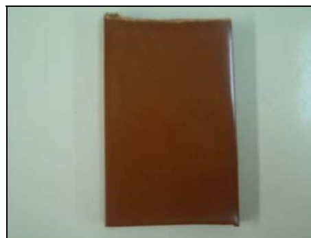
Figura 2: Placa de PMMA/LVB (adicionado 20 % de LVB)

A lama vermelha confere cor característica às chapas, sendo que a mudança de cor por incorporação de colorantes teria grande dificuldade na adequação de novos padrões ao produto obtido conforme a figura 2.