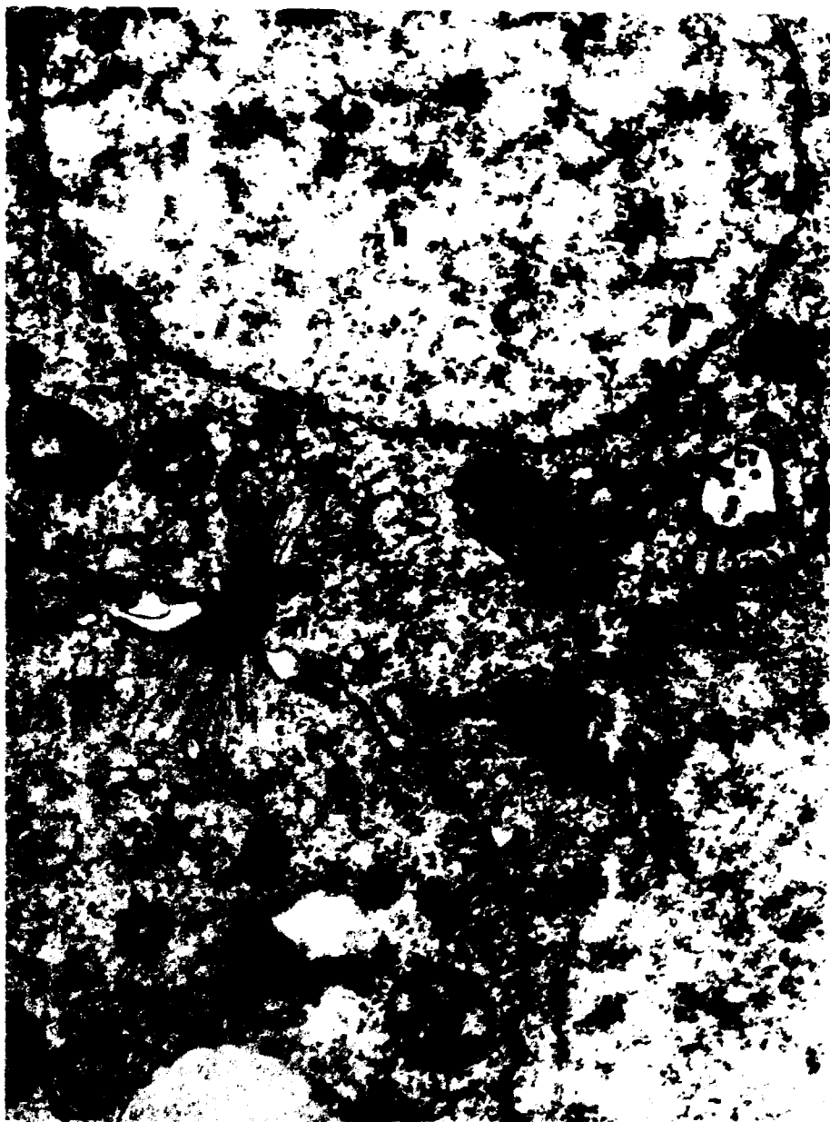
Figura 4. Eletromicrografia mostrando um feixe de microtúbulos (MT) conectando células adjacentes. N = núcleo; M = mitocôndria; Cv = corpo multivesicular; p = polissomos; v = vesículas. A seta indica ribossomos aderidos à membrana externa do envoltório nuclear. 18.800 x.