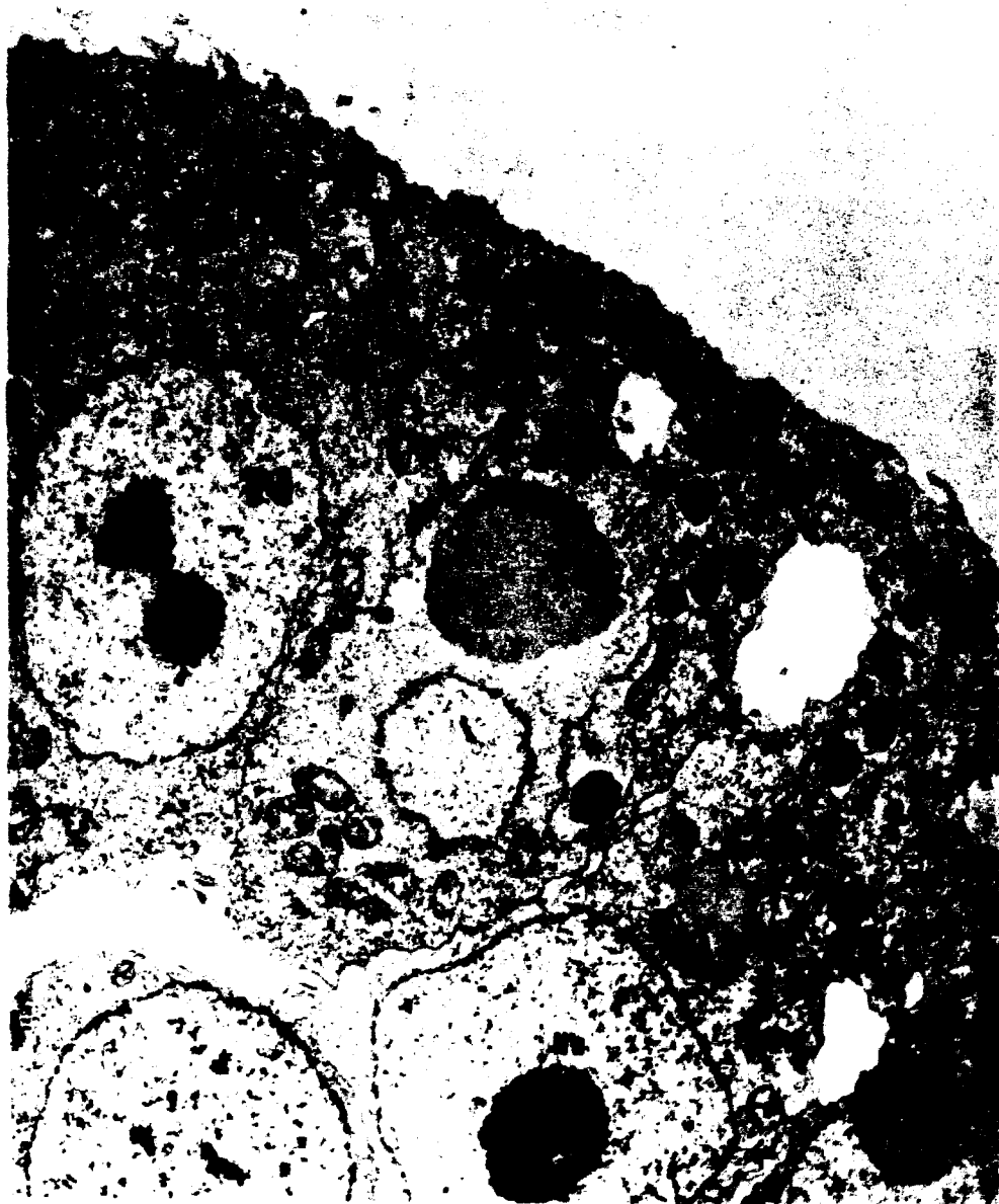
Figura 1. Aspecto geral da ultraestrutura da região periférica do embrião de Biomphalaria glabrata , no estágio de trocófora jovem. N = núcleo; Nu = nucléolo; M = mitocôndria; p = polisomos. 7.200 x.