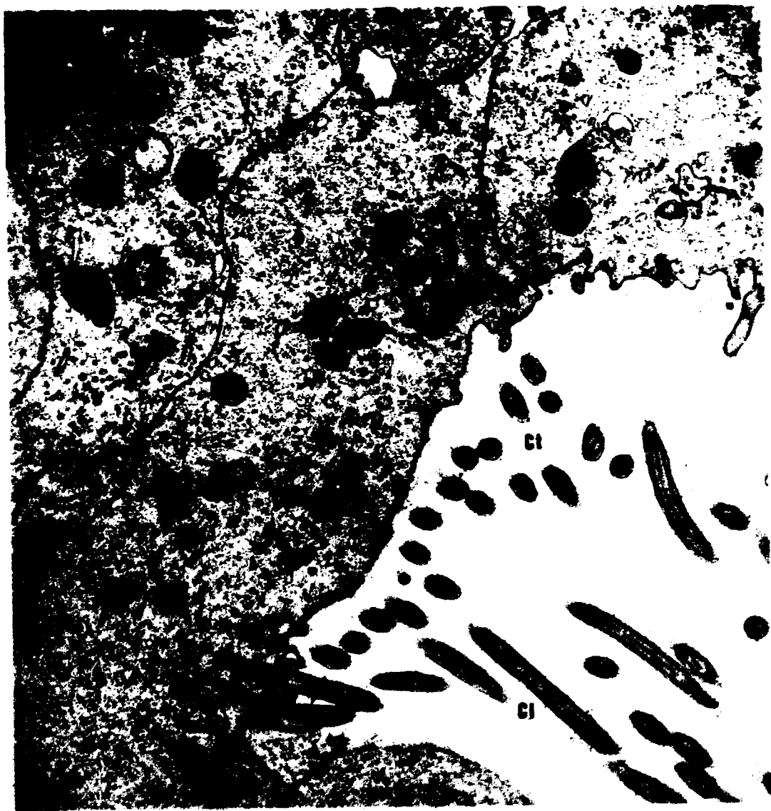
Figura 2. Eletromicrografia das células ciliadas do prototroco. Cl = cílios cortados longitudinalmente; Ct = cílios cortados transversalmente; Ci = cílios implantados na membrana plásmatica ; M = mitocôndria; G = complexo de Golgi; RER = retículo endoplasmático rugoso; p = polissomos; v = vesículas. 18.800 x.