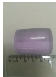
Fig. 1 – Cristal Nd:YLF

finas lâminas (de espessura de um cm, como pode ser observado na figura 2).