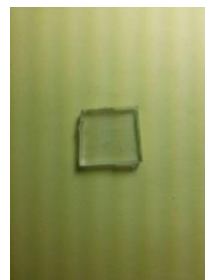
Fig. 2 – Lâminas de Nd:YLF

Estas lâminas são fixadas no Jig, como é possível observar na figura 3. A lapidação e o polimento são realizados em politriz especializada para polimento de cristais.