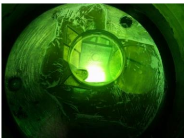
Fig. 4. Primeiro procedimento: Franjas de interferência.

Após o polimento, a qualidade das superfícies das amostras foram analisadas em um microscópio óptico com aumento de quatro vezes, para constatar o resultado [1]. Em seguida, para verificação da superfície, a amostra foi analisada com luz monocromática e polarizada fazendo-se uso de um substrato ótico, de planicidade determinada em \lambda/10 para medir o desvio da planicidade em frações do comprimento de onda [2]. O resultado pode ser observado nas figuras 4 e 5, logo abaixo: