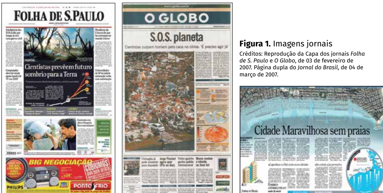
Figura 1. Imagens jornais

Seja como for, a divulgação da ciência é estratégica e fundamental na perspectiva de contribuir para melhor compreensão da importância do conhecimento científico e tecnológico por parte da população em geral. Nesse contexto, as redes